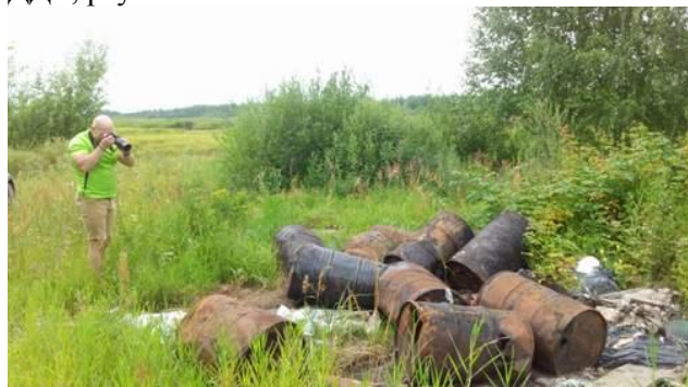
Рис 10 - В ходе общественной инспекции, проведенной НПО «СПЭС», на полигоне ТБО «Игумново», расположенном между г.Н.Новгород и г.Дзержинск, найдено масштабное захоронение ртутных ламп и электронного лома (компьютерная техника).