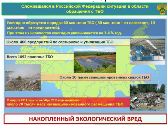
Рис 1 Накопленный экологический ущерб

По данным украинских НПО, система обращения с опасными отходами в стране находится в разбалансированном состоянии, законодательные и регуляторные акты не гармонизированы и зачастую противоречат друг другу. Отсутствуют Национальные балансы и планы управления различными видами опасных отходов. За период 2014 -2015 года у профильное министерство сменило 3 –х руководителей, что обуславливает отсутствие четкой программы в сфере обращения с опасными отходами, среднесрочного и долгосрочного планирования в этом направлении.