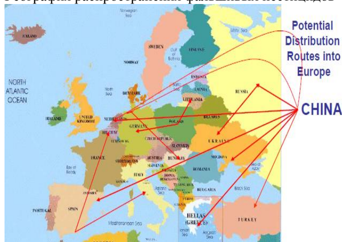
Рис 5 География распространения фальшивых пестицидов

Выявленные фальшивые пестициды являются опасными отходами, преградить доступ которым в страны становится все труднее. Другими серьезными проблемами в этой сфере является торговля через интернет, контрабанда мелкими партиями под видом частного использования, семена, протравленные неизвестными агрохимикатами.