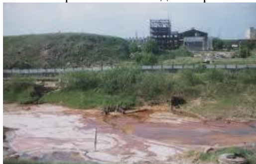
Рис 6 Зброшенний завод «Капролактан» в Дзержинске

После закрытия в 2013 году завода «Капролактан», включая самое северное производство хлора под открытым небом владельцем производственной площадки стало ОАО «Индустриальный парк «Ока-полимер». Как сообщил представитель НПО «СПЭС», в настоящее время руководство индустриального парка отказывается предоставлять информацию об объемах отходов.