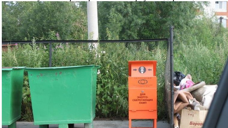
Рис 13. Пункт сбора отработанных ртутьсодержащих ламп

Участники семинара в Минске обсудили требования Конвенции Минамата к товарам, содержащим ртуть, включая энергосберегающие лампы. Подчеркивалось, что, согласно Конвенции, к продуктам, подлежащим поэтапному выводу из оборота до 2020 г., относятся аккумуляторы; большинство переключателей и реле; КФЛ мощностью 30 или менее ватт, содержащие более 5 мг ртути на единицу (необычно высокое количество); трубчатые флуоресцентные лампы – трубчатые лампы мощностью менее 60 ватт с содержанием ртути более 5 мг и лампы с галофосфатным люминофором мощностью менее 40 ватт с содержанием ртути более 10 мг; ртутные лампы высокого давления; ртуть в различных флуоресцентных лампах с холодным катодом и лампах с внешним электродом; косметические продукты, включая косметику для осветления кожи с содержанием ртути более 1 части на миллион за исключением косметики для зоны глаз (поскольку в соглашении утверждается, что эффективных и более безопасных