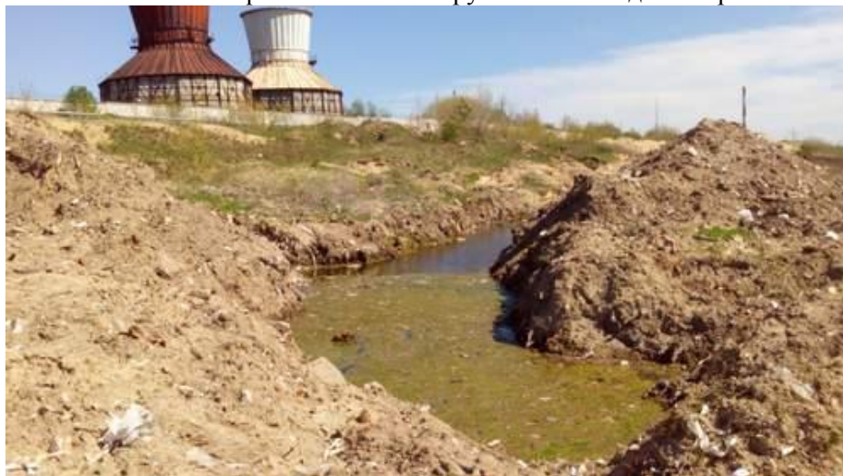
Рис 7 Отстойники старых очистных сооружений на заводе «Капролактан»

После закрытия в 2013 году завода «Капролактан», включая самое северное производство хлора под открытым небом владельцем производственной площадки стало ОАО «Индустриальный парк «Ока-полимер». Как сообщил представитель НПО «СПЭС», в настоящее время руководство индустриального парка отказывается предоставлять информацию об объемах отходов.