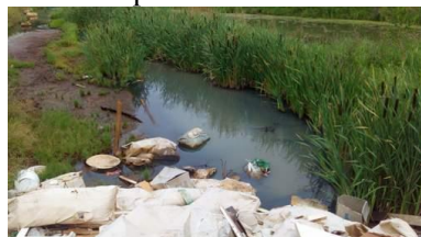
Рис 9- 3 нелегальных захоронения пестицидов в водоохранной зоне р.Ока (2006-2008 гг) включая ДДТ, ртуть.