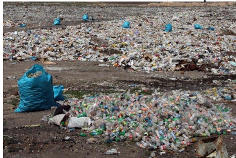
Рис 2. Пластиковые отходы в Армении

Участники семинара подчеркнули, что отходы – это прибыльный бизнес. Коррупция, дерегуляция, монополизация очевидны во всех странах региона. Бизнес пытается монополизировать обращение с отходами, что находит отражение в законодательных актах, которые разрабатываются при активном участии бизнеса.